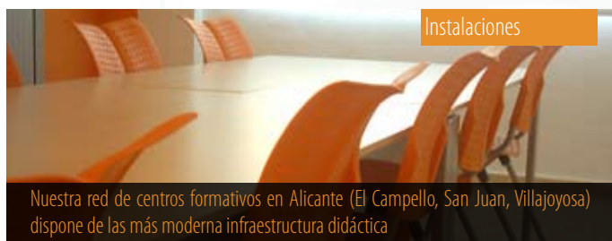
Nuestra red de centros formativos en Alicante (El Campello, San Juan, Villajoyosa) dispone de la más moderna infraestructura didáctica

Multimets formación dispone de tres centros formativos en la provincia de Alicante, homologados por distintas instituciones oficiales, con más de 900 m 2 equipados con todos los requisitos técnicos que garantizan el entorno de aprendizaje moderno y funcional. Nuestros centros formativos disponen de un amplio horario y están abiertos todo el año (excepto Navidad y fiestas locales) para facilitar la conciliación de la vida familiar y laboral.